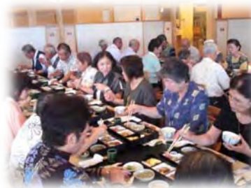
昼食は加賀屋有明店にて 日本料理「加賀屋御膳」で 参加者の親睦を深める

東京臨海広域防災公園見学、体験学習ツアーに参加し、改めて、防災の備えや心構えを痛感した。