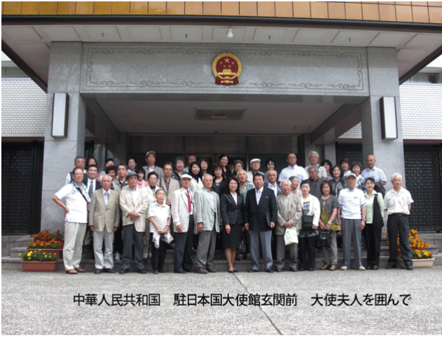
中華人民共和国 駐日本国大使館玄関前 大使夫人を囲んで